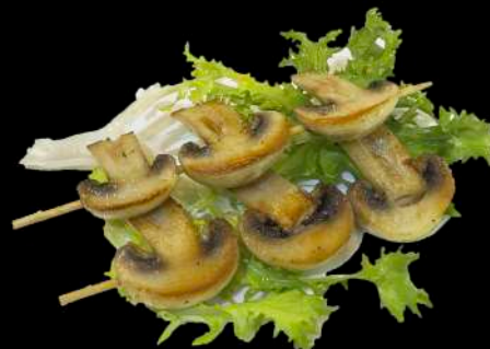
242. SPIEDINI DI FUNGHI ALLA PIASTRA € 4.00