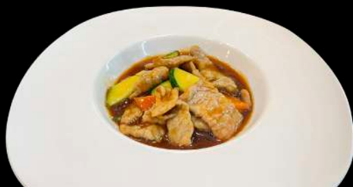
264. VITELLO ALLA SALTATO CON VERDURE € 7.00