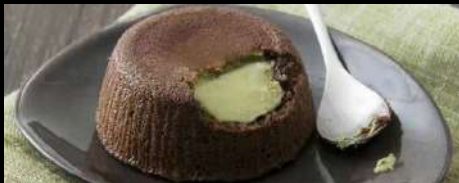
313. SOUFFLÉ AL PISTACCHIO Soufflé al cioccolato con cuore al pistacchio liquido € 5.00