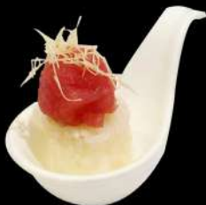
110. NIDO MAGURO

tonno piccante, kataifi, sesamo, teriyaki