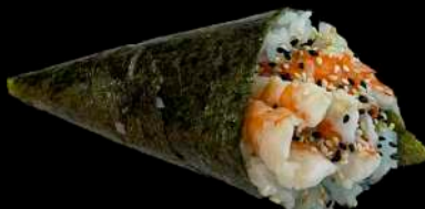
52. EBI gamberi* cotto, avocado