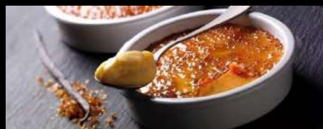
316. CREMA CATALANA IN COCCIO Crema catalana con zucchero caramellato € 6.00