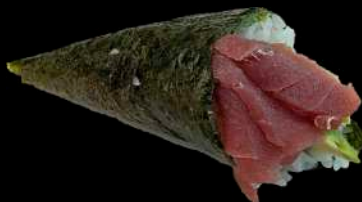
46. MAGURO tonno, avocado