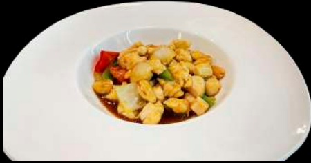
255. POLLO AL MANDORLE