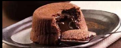
314. SOUFFLÉ AL CIOCCOLATO Soufflé con cuore di cioccolato liquido € 5.00