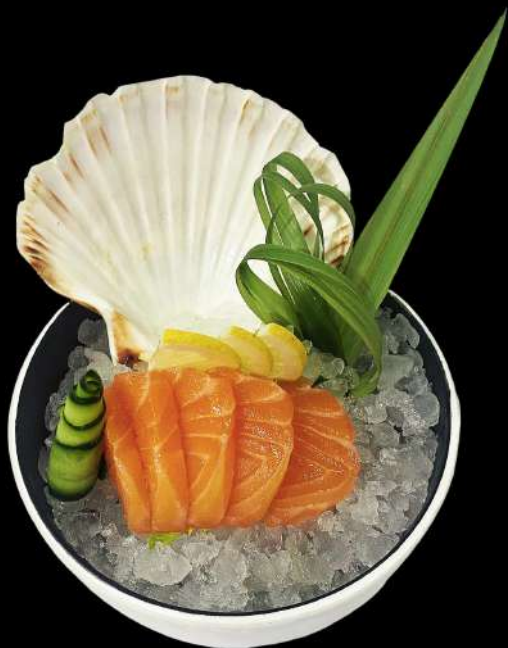
154. SASHIMI SALMONE 4PZ