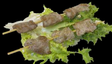
244. SPIEDINI DI VITELLO ALLA PIASTRA € 5.00