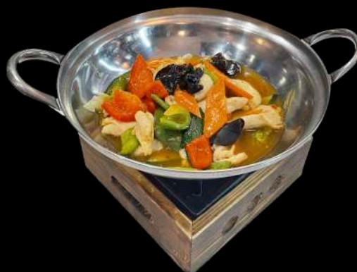
277. POLLO IN HOT POT verdure miste, pollo, piccante € 7.00