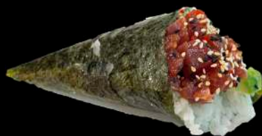
48. TUNA SPICY tonno piccante, avocado