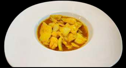
257. POLLO AL CURRY