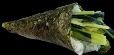
49. VEGETALE avocado, cetriolo