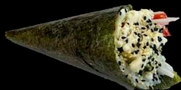
51. SURIMI surimi*, avocado