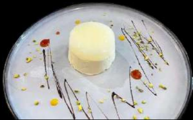
309. MIRO LIMONE € 4.50