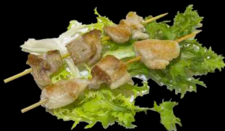
243. SPIEDINI DI POLLO ALLA PIASTRA € 5.00