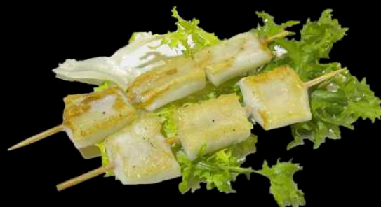
247. SPIEDINI DI CALAMARI*