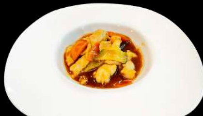
259. POLLO ALLA SALTATO CON VERDURE