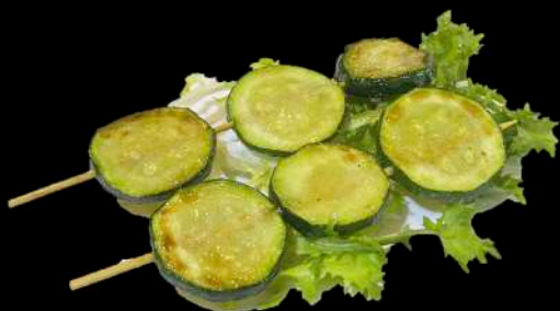
241. SPIEDINI DI ZUCCHINA ALLA PIASTRA € 4.00