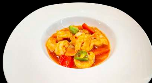
269. GAMBERI IN SALSA PICCANTE gamberi*, peperoni, cipolla e salsa piccante