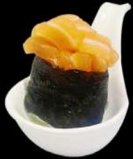
104. NORI SAKE