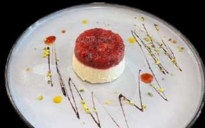
310. MIRO FRUTTI BOSCO € 4.50