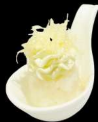
108. NIDO PHILA