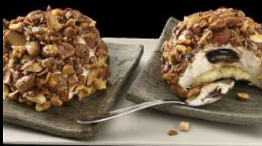
311. MANDARINO tardivo di Ciaculli e crema semifredda ai limoni Siciliani, con un cuore liquido agli agrumi, su una base di Pan di Spagna € 6.00