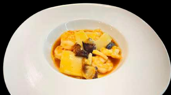
270. GAMBERI* SALTATO CON FUNGHI E BAMBÙ € 8.00