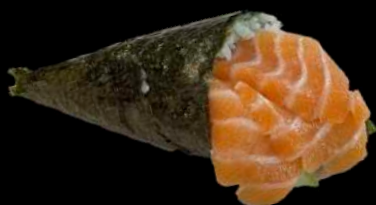
45. SAKE salmon, avocado