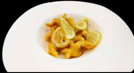
256. POLLO AL LIMONE