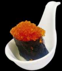
106. NORI TOBIKO*