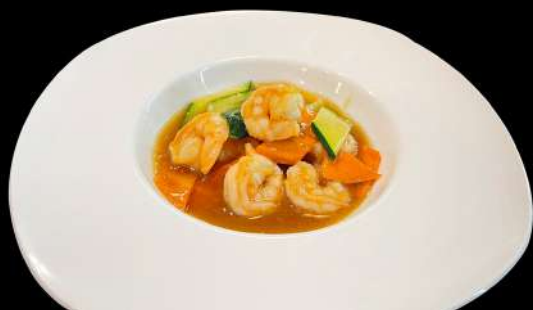
268. GAMBERI* SALTATI CON VERDURE € 8.00