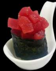
105. NORI MAGURO