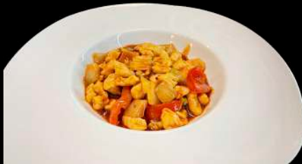
258. POLLO CON SALSA PICCANTE

pollo, peperoni, cipolla e salsa piccante