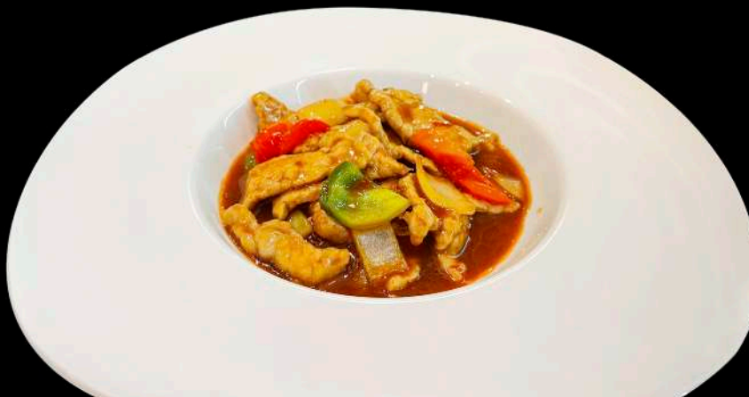
263. VITELLO IN SALSA PICCANTE