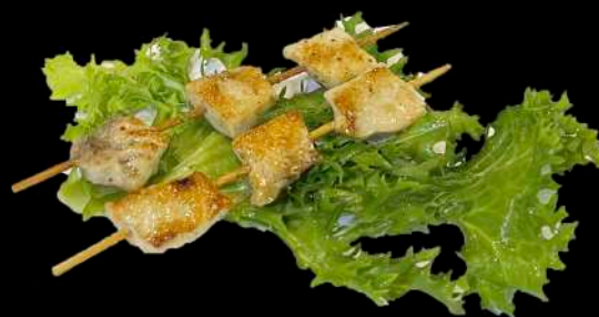
249. SPIEDINI DI PESCE SPADA ALLA GREGLIA