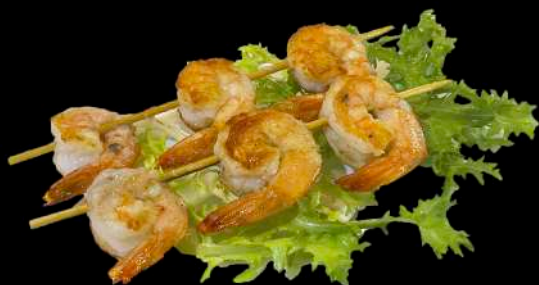
246. SPIEDINI DI GAMBERNI ALLA PIASTRA*