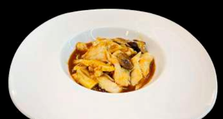
261. POLLO SALTATO CON FUNGHI E BAMBÙ