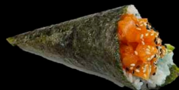
47. SAKE SPICY salmon piccante, avocado