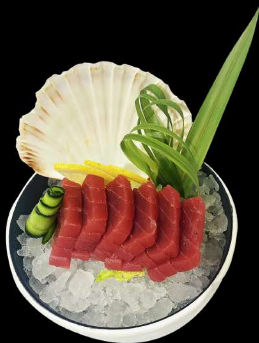
155. SASHIMI TONNO 4PZ