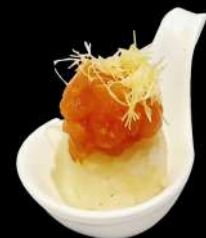
109. NIDO SAKE

salmone piccante, kataifi, sesamo, teriyaki