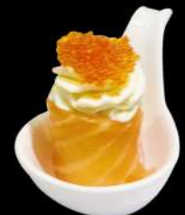
113. GUNKAN TOBIKO