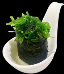
107. NORI WAKAME*