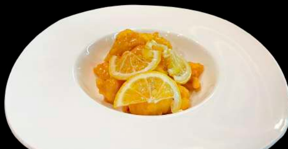
265. GAMBERI AL LIMONE gamberi* fritti con sala limone € 8.00