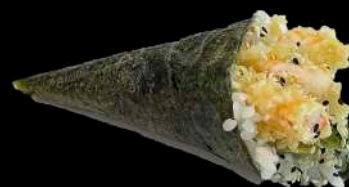
50. EBI FRITTI tempura di gamberi*, avocado e salsa teriyaki