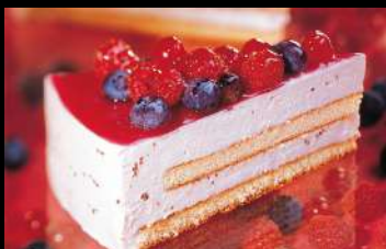
315. MOUSSE YOGURT E FRUTTI DI BOSCO Mousse preparata con yogurt e decorata con lamponi, mirtilli e ribes € 4.50