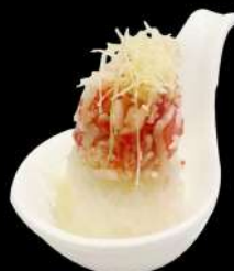
111. NIDO SURIMI

surimi*, maionese, sesamo, kataifi, teriyaki