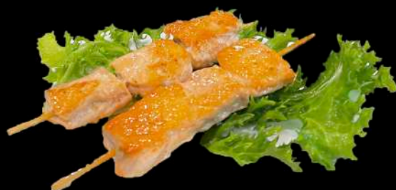
248. SPIEDINI DI SALMONE ALLA GRIGLIA