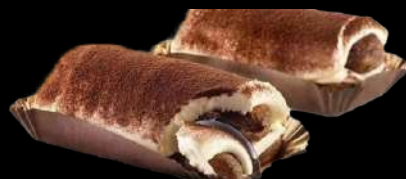
312. TIRAMISÙ CON SAVOIARDI Crema al mascarpone e savoiardi inzuppati al caffè € 5.00