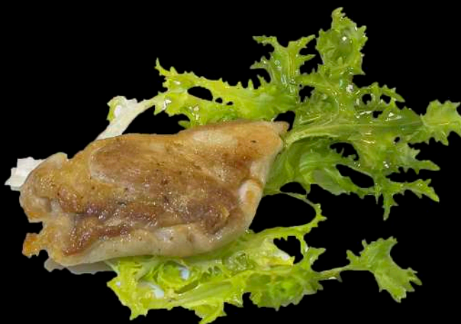
245. COSCE DI POLLO ALLA PIASTRA € 5.00